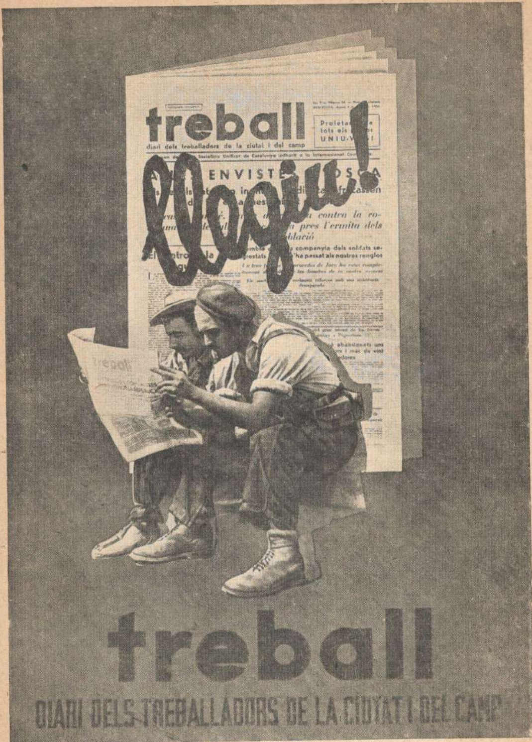
Мичель Адам. «Труд» прибыл! «Труд» — газета трудящихся города и деревни!