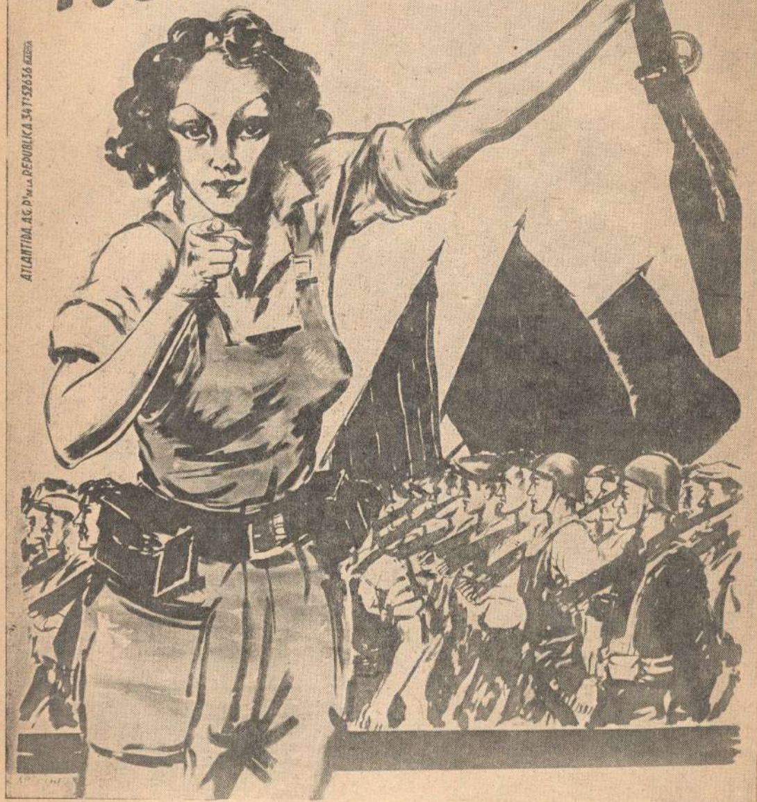
Артече. «Ты нужен милиции!»

ATLANTIDA. AG. D'IMP. LA REPUBLICA 34 T' 52656 ADISA