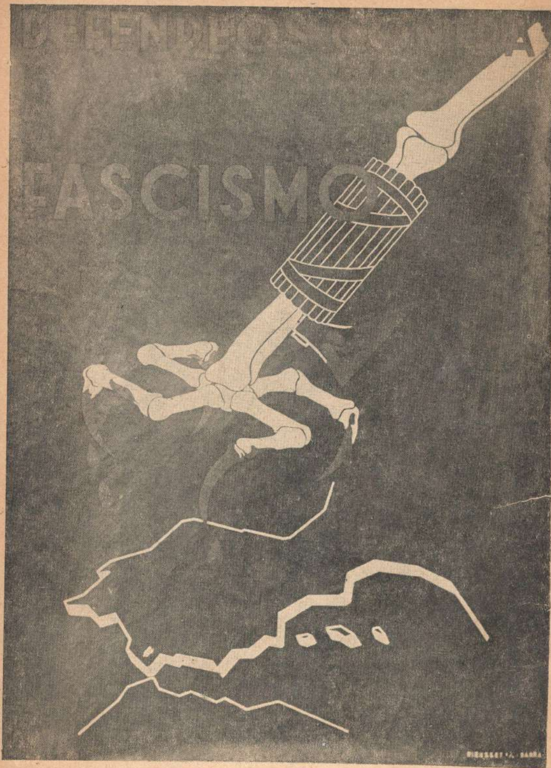
Плакат неизвестного художника. «Защищайте себя от когтей фашизма!»