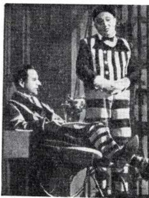
Сцена из спектакля «Знаменитый 702».

«Более того, — продолжает журнал, — здесь торжествует идея театра, в котором сцена является главным, но не единственным местом действия. Плакаты, фотографии в фойе, программа, сохраняющие дух пьесы, ин-