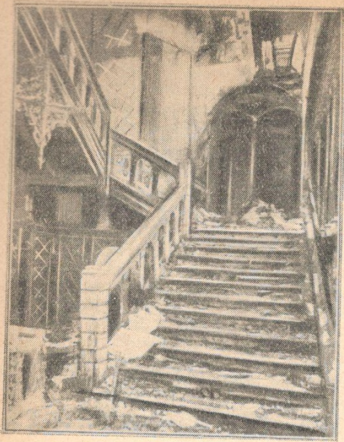
Бомбардировкой разрушена известная библиотека Холдейн-хауса. В начале XIX века в этой библиотеке собирались известнейшие писатели, художники, артисты и политические деятели

рои попадают в самые невероятные положения; действие начинается в Париже и кончается в Индо-Китае. Материал «Опасного молодого человека» Джорджа Вортса взят из быта нью-йоркских гангстеров, шантажистов, воров. Чарльз Барри дает книгу под названием «Мертвые молчат». Даже такое солидное издательство, как «Оксфорд юниверсити пресс», также отдало дань детективу, выпустив книгу Реджинальда Муриша — «Полиция и современные методы раскрытия преступлений».